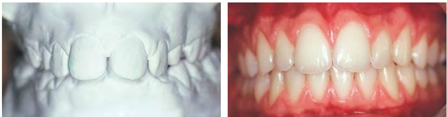
Hubert, avant traitement.

3 activateurs plurifonctionnels parmi les modèles existants. Leur utilisation permet d'obtenir systématiquement les résultats visibles ci-dessous.