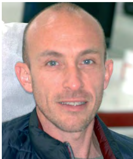
Juillet 2016, 12 ans après la fin du traitement.