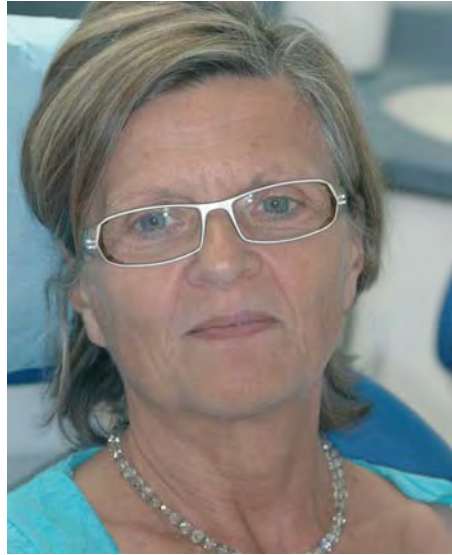
6 mois après le début du traitement.

- ensuite, si le dentiste fait en sorte que toutes ses décisions thérapeuthiques correspondent au mieux à son patient, en prenant en compte tous les renseignements que celui-ci donne ou laisse filtrer (son évolution, son ressenti, ses ouvertures ou ses doutes, ses craintes inconscientes). Cette relation est donc basée, tout au long du traitement, sur l'attention que le dentiste porte à son patient.