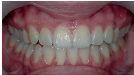
D. à 14 ans.

L'amélioration de l'équilibre buccal est le signe d'un changement d'attitude et de comportement des patients envers eux-mêmes ; par atténuation des difficultés psychiques et renforcement des points forts du tempérament. Cela s'accompagne bien entendu d'un changement dans le rapport aux autres.