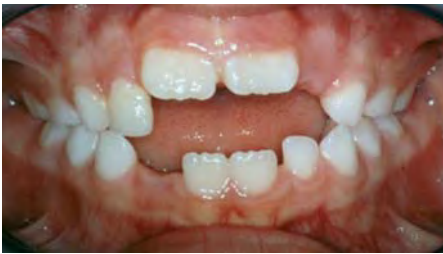
D. à 8 ans.